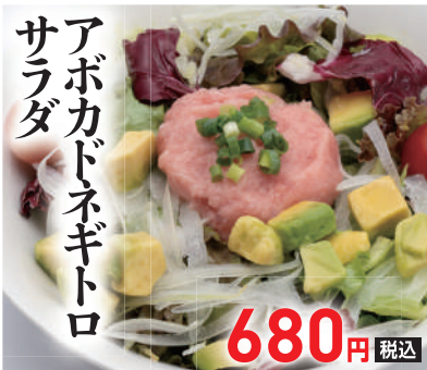
アボカドネギトロ サラダ