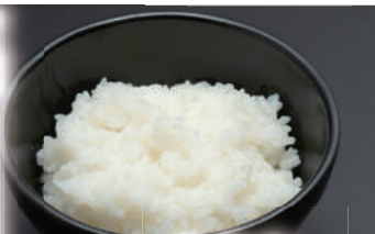
ご飯 〔長野県産米〕使用