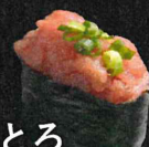
ねぎとろ 軍艦 430円 (税抜 391円)