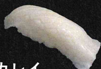
カレイ えんがわ 240円 (税抜 218円)