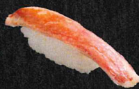
ずわいがに 430円 (税抜 391円)