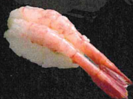
甘えび 240円 (税抜 218円)