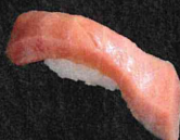
中とろ 430円 (税抜 391円)