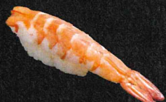
蒸しえび 240円 (税抜 218円)