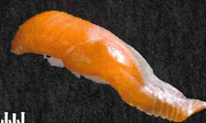
信州 サーモン 240円 (税抜 218円)