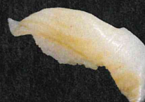
ひらめ 430円 (税抜 391円)