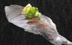
あじ 430円 (税抜 391円)