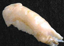
つぶ貝 430円 (税抜 391円)