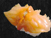
赤貝 600円 (税抜 545円)