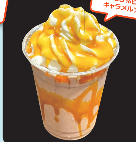
キャラメルモカ エスプレッソフラッペ ¥480