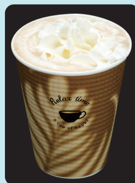
ウインナーコーヒー ¥300