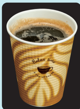
モカコーヒー ホット ¥200