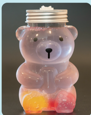
ゆめかわ ソーダ カップ¥580 ボトル¥880