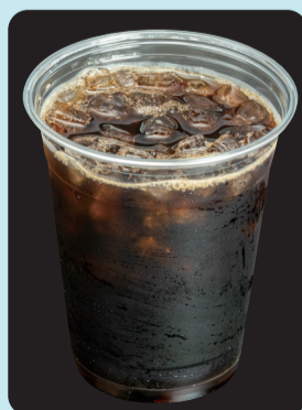
モカコーヒー アイス ¥200