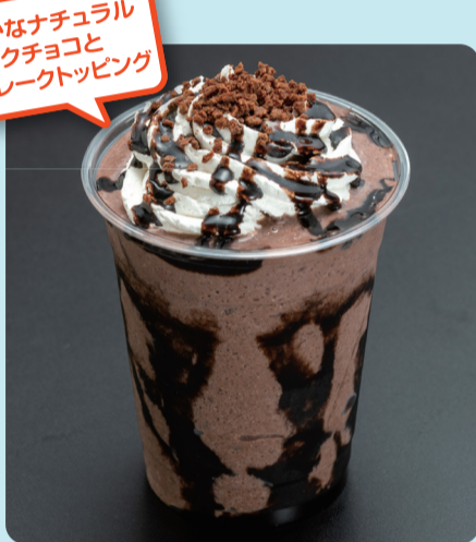
ダブルチョコフラッペ ¥580