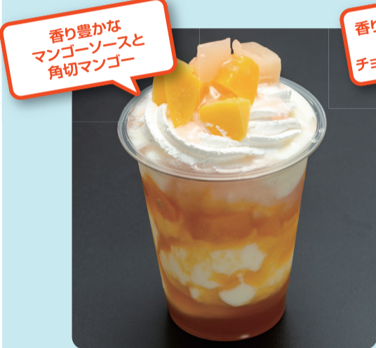
マンゴーフラッペ ¥550