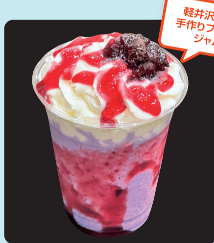
ブルーベリーフラッペ ¥650