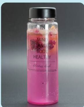
フルシュワ ソーダ カップ¥580 ボトル¥880